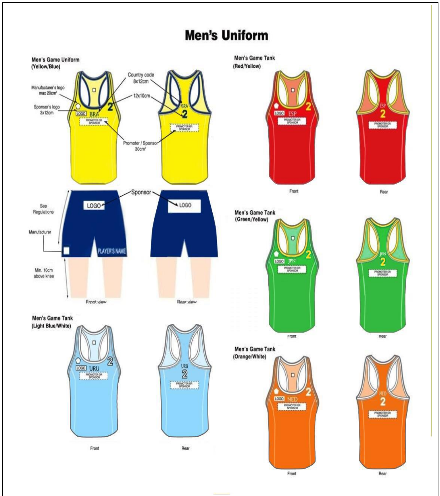
男子球員比賽服裝圖示